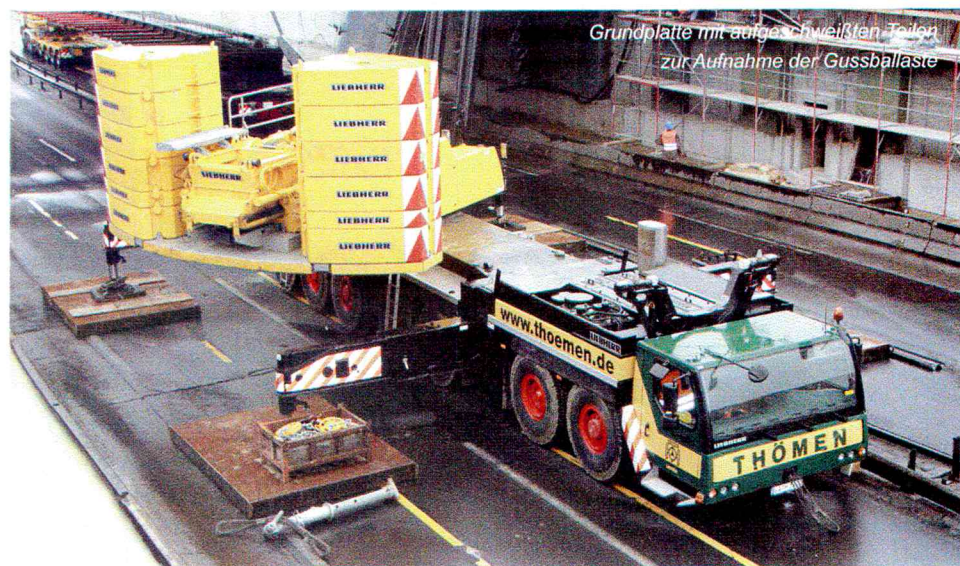
Grundplatte mit angelegten Schweißteilen zur Aufnahme der Gussballaste

Mit einem neuen Vertriebsbüro in Essen unterstützt Jebens die kundennahe Marktbearbeitung in der Rhein-Ruhr-Region sowie in Norddeutschland. So aufgestellt präsentiert sich das Unternehmen auf der bauma als attraktiver Partner für eine Vielzahl von Aufgaben im Maschinenbau.