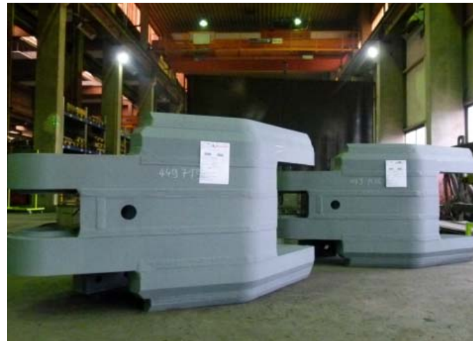
Bild 6: Die besonders flache Geometrie der Presse erforderte eine anspruchsvolle Sonderkonstruktion der Zange für den Schmiedemanipulator.