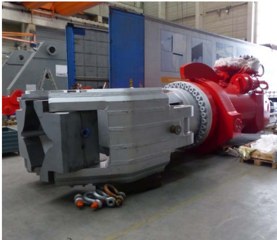
Bild 9: Die Zange mit Drehantrieb mit den von Jebens gefertigten Bauteilen im montiertem Zustand.