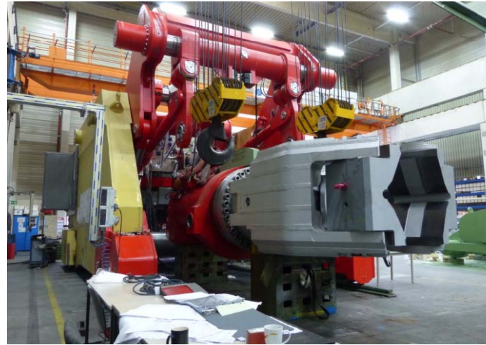
Bild 2: Für einen amerikanischen Kunden baute Dango & Dienenthal einen schienegebundenen Manipulator Typ SSM 2000 – 14 Meter lang, 5,6 Meter breit und 4,5 Meter hoch.