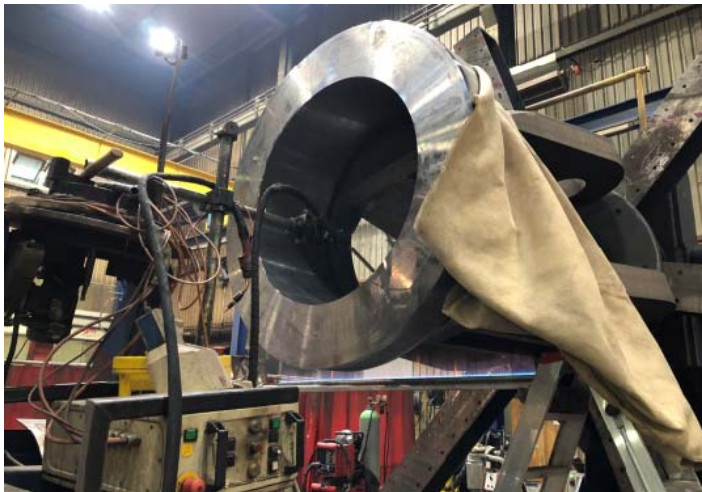
Bild 5: Bei der Bearbeitung der Kombination aus warmfesten Werkstoffen und Baustahl bewährte sich die Expertise der Jebens-Spezialisten.