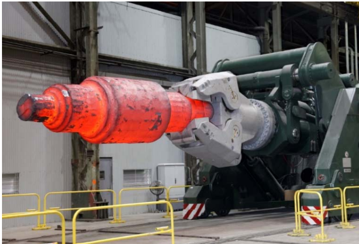
Bild 3: Jebens übernahm den Bau des speziell geformten Zangenkopfes und der Zangenschenkel sowie von Teilen des Hauptrahmens und Öltanks für den Schwiedemanipulator vom Typ SSM 2000.