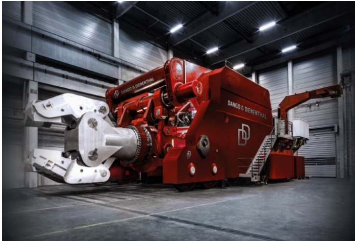
Bild 1: Für die schienegebundenen Manipulatoren von Dango & Dienenthal mit extrem hohen Traglasten liefert Jebens Zangenkopf und Zangenschenkel sowie Teile des Hauptrahmens und Öltanks.