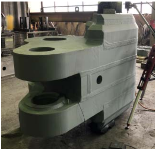
Bild 7: Trotz ihrer ungewöhnlich flachen Form hält die Zange des Schmiedemanipulators Teile mit Gewichten von bis zu 900 kN.