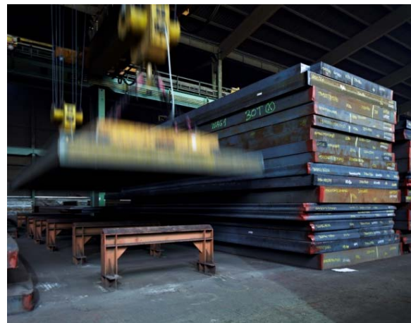
Bild 12: Jebens punktet mit seinem Vorrat an 30.000 Tonnen Grobblechen und Brammen bis 650 Millimeter Dicke.