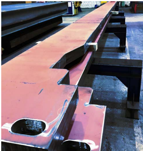
Bild 1: Jebens fertigt zwei 16.500 Millimeter lange und 100 Millimeter dicke Seitenholme in feinstebener Ausführung für die große Kammerfilterpresse.