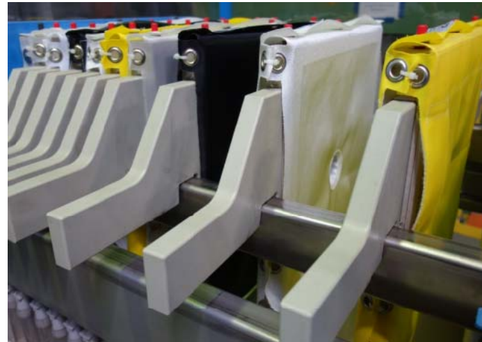
Bild 8: In den Kammerfilterpressen von Filox kommen anwendungsspezifisch ausgelegte Kunststoffgewebe zum Einsatz.