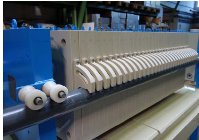
Bild 6: Ein Hydraulizylinder schiebt die Filterplatten mit hohem Druck zusammen, sodass keine Flüssigkeit an den Seiten der Presse herausdringt.