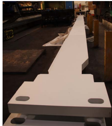
Bild 2: Die je 6,8 Tonnen schweren Seitenholme von Jebens sind in einer XXL-Filterpresse mit 800 Tonnen Presskraft zur Palmölfractionierung im Einsatz.