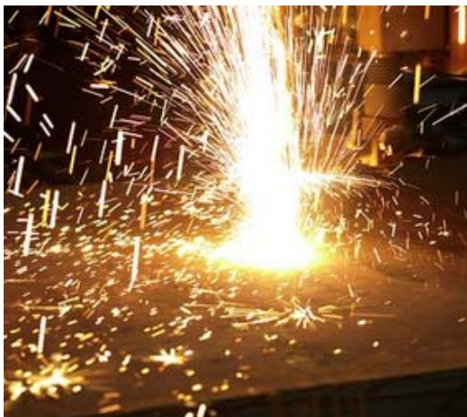
Bild 11: Für Jebens spricht die aus früheren Projekten bekannte präzise Bearbeitung der Bleche.

Das Bildmaterial darf ausschließlich für den hier genannten Text der Jebens GmbH verwendet werden. Jede darüber hinausgehende, insbesondere firmenfremde Nutzung, wird ausdrücklich untersagt.