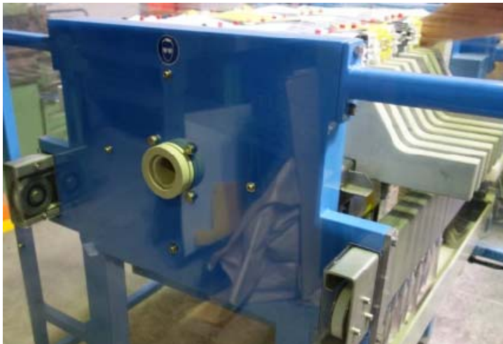
Bild 7: Zuführung für die Suspension an einer Filox-Filterpresse.