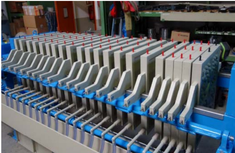
Bild 5: In den Filterpressen von Filox werden anwendungsbezogen ausgelegte Filterplatten zu Filterpaketen zusammengefasst und in einem Gestell zwischen zwei Abdeckplatten angeordnet.