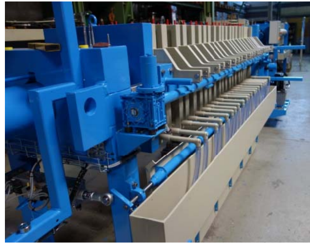
Bild 4: Bei dieser kontinuierlichen Filterpresse wird der Filterkuchen durch ein automatisiertes Abreinigungsverfahren entfernt.