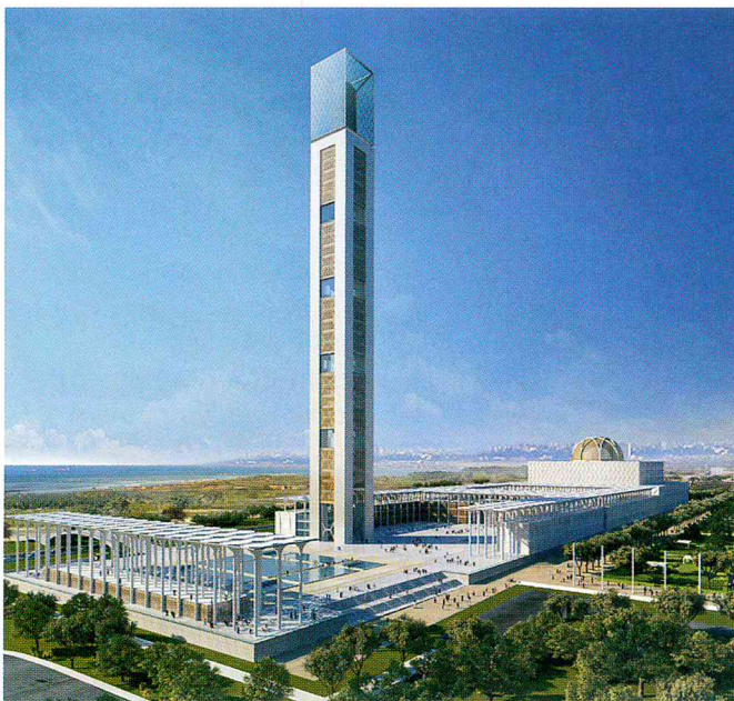
Bild 1. In Algier entsteht derzeit die drittgrößte Moschee der Welt. Der moderne Gebäudekomplex Djamaa el Djazair mit einem 265 Meter hohen Minarett übertrifft in seinen räumlichen Dimensionen sogar den Petersdom

Die Djamaa el Djazair ist aber vom Anspruch her weit mehr als nur ein Gotteshaus. Nach den Vorstellungen des Architekten soll sie auch Motor für Algiers Stadtentwicklung sein. Der moderne Komplex vereint deshalb eine Vielzahl kultureller und religiöser Einrichtungen, darunter ein Museum und Forschungszentrum, Kultur- und Konferenzzentren, einen Hörsaal der theologischen Hochschule mit 2.000 Plätzen sowie eine Bibliothek mit einer Million Medien. Wohnungen, Marktplatz, Cafés und ein Kindergarten sollen den urbanen Gedanken überdies