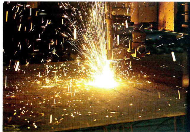
Bild 3. Die exakt nach Kundenvorgaben gefertigten Brennzuschnitte inkl. Schweißnahtvorbereitungen für die Fußplatten werden direkt in die Betonsäulen eingeschleudert

stärken. Auch das Minarett im Wolkenkratzerformat ist in der oberen Stockwerken für die Öffentlichkeit zugelassen, die per Panoramalift zu einer Aussichtsplattform gelangt. Trotz seiner immensen Größe wirkt der Gesamtentwurf der Moschee filigran und luftig. Entscheidenden Einfluss darauf haben die durchgängig gewählte weiße Farbgebung und extrem schlanke Bauelemente. So hat das 265 m hohe Minarett nur eine quadratische Grundfläche von 28 m Seitenlänge. Nachts leuchtet seine Glasfassade geheimnisvoll hinter der filigranen islamischen Ornamentik mittig vorgehängter Faserbetonplatten. Sie wurden in Natursteinoptik nach dem Vorbild der traditionellen, hölzernen Moucharabieh-Sonnen- und Sichtschutzgitter gegossen. Der Muscheenkomplex verliert seine faktische Wuchtigkeit auch durch seine Platzierung auf einem bis zu 5 m hohen Sockel, der ihm eine schwebende Anmutung verleiht. Auf ihm sind entlang der Achse in Richtung Mekka die einzelnen Bauwerke von West nach Ost angeordnet.