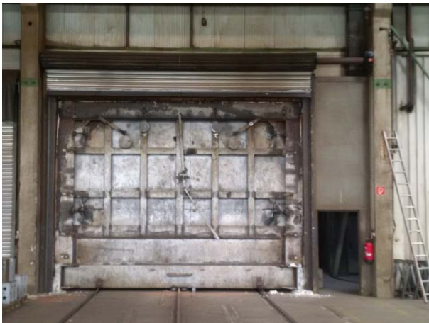
Bild 8: In dem XXL-Glühofen von Jebens wurden die Einzelteile und Komponenten des Pressenstößels geblüht.