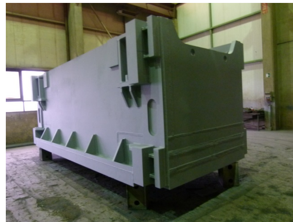
Bild 5: Stößel im XXL-Format made by Jebens: 66 Tonnen schwer, 2.600 Millimeter hoch, 2.200 Milli-meter breit und 6.000 Millimeter lang.