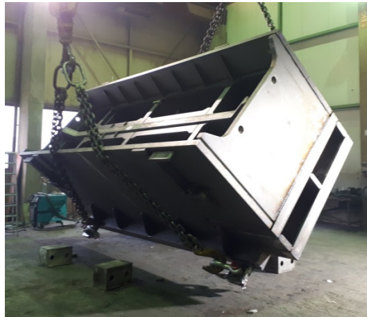
Bild 2+3: Jebens berechnete nach der Zeichnung von Ropa alle Schweißnähte neu und legte sie entsprechend aus.