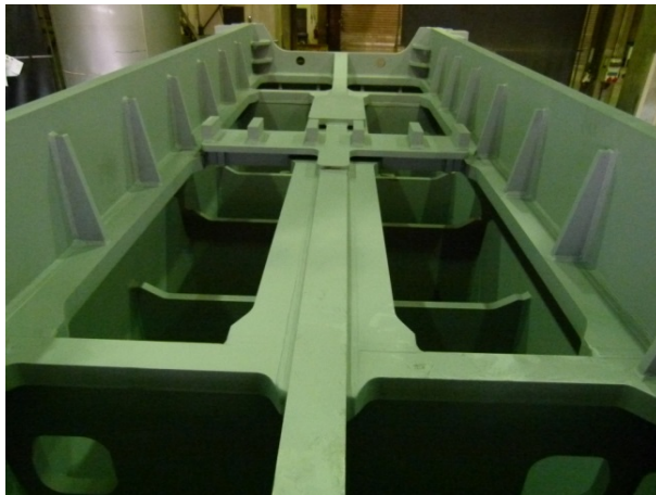
Bild 4: Alle Bereiche, an denen der Stößel mehr Kraft aufnehmen muss, wurden für eine maximale Anbindung besonders stark angefast.

Das Bildmaterial darf ausschließlich für das hier genannte Thema der Jebens GmbH verwendet werden. Jede darüber hinausgehende, insbesondere firmenfremde Nutzung, wird ausdrücklich untersagt.