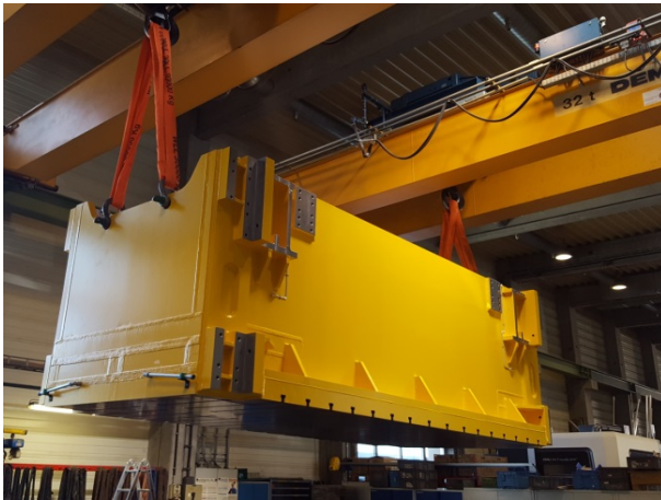
Bild 6: Nach Spannungsarmglühen, Strahlen und Grundieren übernahm Jebens auch den Transport zur anschließenden mechanischen Bearbeitung des Kolosses.