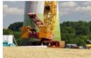
Bild 5-6: Gewichtsaufnahme unter Verwendung von hochfesten Stählen.