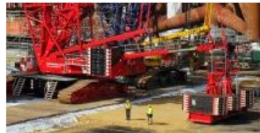
Bild 1+2: Gewichtsaufnahmen am Raupenkran LR 1750.