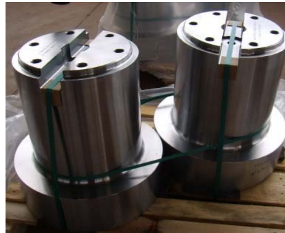
Bild 6: Die beiden 700 Kilogramm schweren, geschmiedeten Tragzapfen.