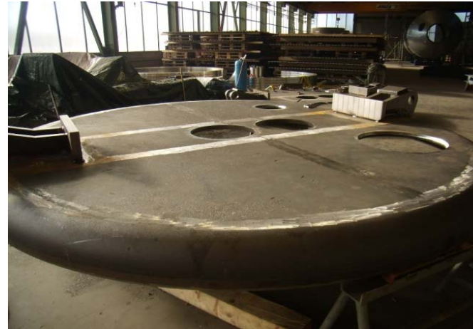
Bild 2: Der Pfannenboden mit den Löchern für Temperatursensoren, Abstich und Gasspülung.