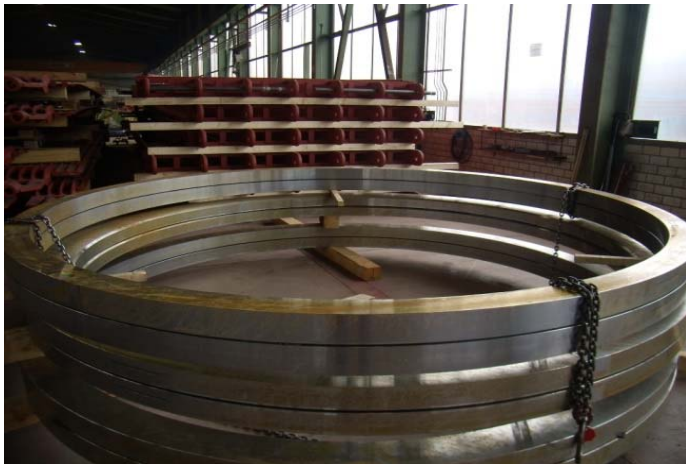
Bild 5: Massive Vollringe verstärken den konischen Pfannenmantel.