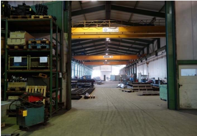
Bild 1: An zwei Standorten mit insgesamt 23.000 Quadratmetern Fläche baut die Wessel GmbH Kessel und Druckbehälter.