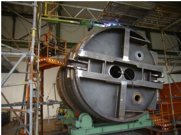
Bild 11: Die Fertigungsvorrichtung senkt die Zeiten, in denen der auf dem Gerüst liegende Schweißer in Zwangslage schweißen muss.