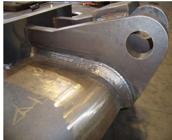
Bild 8: Insgesamt fertigte Wessel fast 550 Kilogramm Schweißnaht für die Gießpfanne.

Bild 5-8: © Wessel GmbH Kessel- und Apparatebau