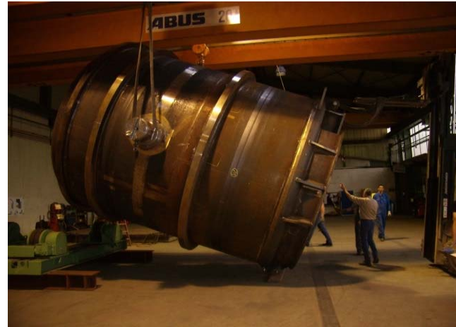
Bild 14: 3,90 Meter hoch mit fast 3,80 Meter im Durchmesser ist die Pfanne ein großes Kaliber.