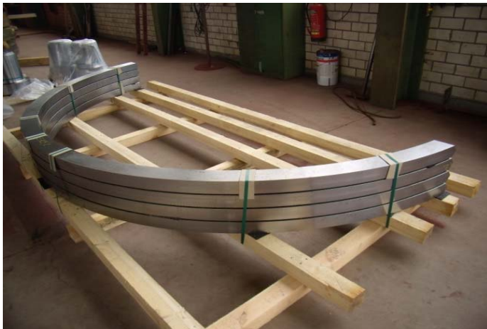
Bild 7: Auf Höhe der Tragzapfen verstärken halbmondförmige Verstärkungsringe die Pfanne.