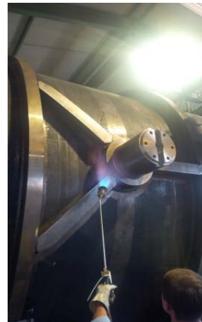
Bild 12: Beim Anschweißen der einzelnen Anbauteile arbeiten zwölf Schweißer im Dreischichtbetrieb.