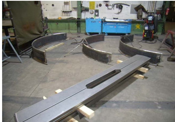
Bild 4: Neben den Rippen mit gewollter Torsion fertigte Jebens auch die Fußteile der Pfanne.