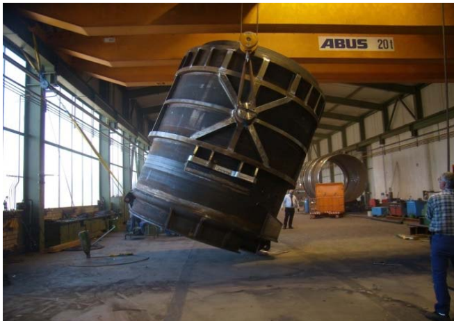
Bild 15-16: Nach der Fertigstellung brachte die Pfanne rund 24,5 Tonnen auf die Waage.