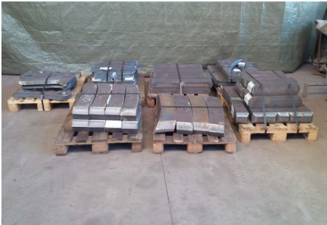
Bild 3: Zur Verstärkung der kegelförmigen Pfannengeometrie fertigte die Jebens GmbH durch 3D-Brennen 28 leicht spiralförmige Rippen.