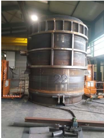
Bild 13: Die leicht kegelförmige Pfanne mit den ersten Anbauteilen.