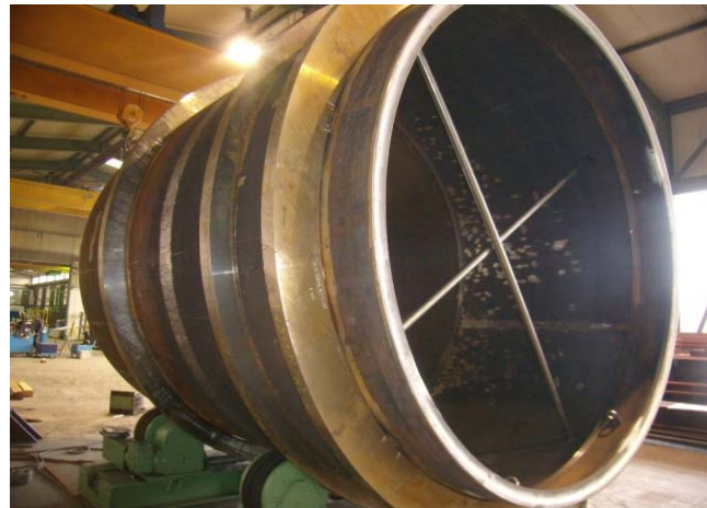
Bild 10: Zur Minimierung von Kranbewegungen nutzte Wessel eine eigens angepasste Fertigungsvorrichtung mit Rollgang.