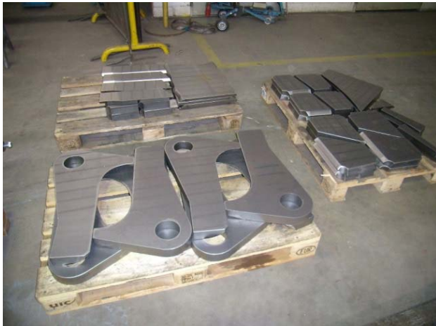
Bild 9: Jebens fertigte auch die Brennteile für die Kippvorrichtung und den Sockel.