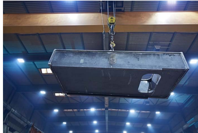
Bild 2: Das 4.000 m 2 große Werk in Nördlingen verfügt über eine Gesamthandlungskapazität von 160 Tonnen.