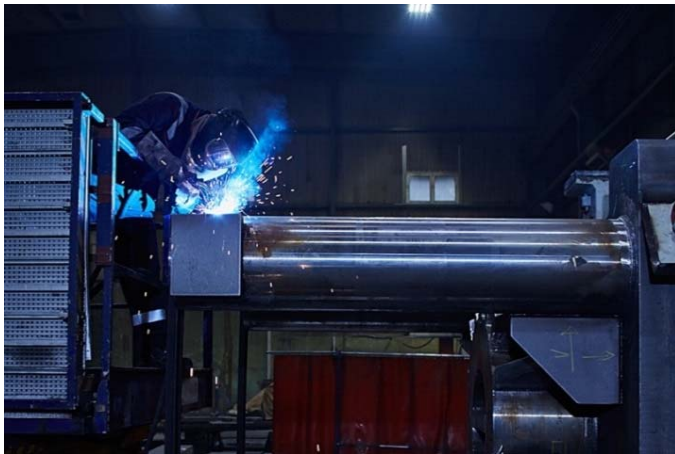
Bild 5: Qualifizierte Mitarbeiter mit Schweißerprüfungen nach ISO 9606 und Zulassungen bis Mat. Güte S960 sind die Grundlage für die Jebens-Zertifizierung nach DIN EN 1090-2 EXC 4 und ISO 3834.