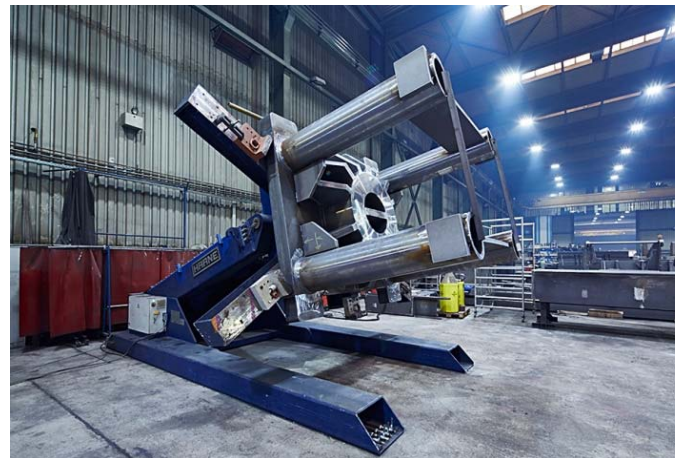
Bild 4: Auf dem Drehtisch bearbeitet Jebens bis zu 35 Tonnen schwere Baugruppen.

Gerne senden wir Ihnen diese oder weitere Motive in druckfähiger Auflösung per E-Mail.