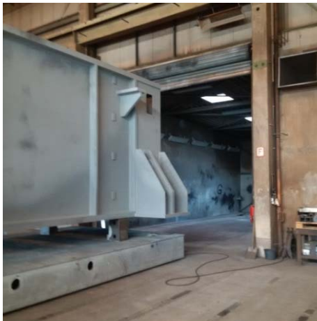
Bild 7: Im Nördlinger -XXL-Glühofen verleiht Jebens durch Wärmebehandlung bis zu 13,5 Meter langen Guss- oder Stahlkomponenten maßgeschneiderte Eigenschaften.

Gerne senden wir Ihnen diese oder weitere Motive in druckfähiger Auflösung per E-Mail.