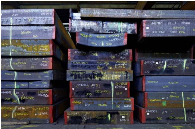
Bild 1: Jebens setzt mit siebenstufiger Fertigungskompetenz Maßstäbe bei der Produktion echter Schwergewichte.