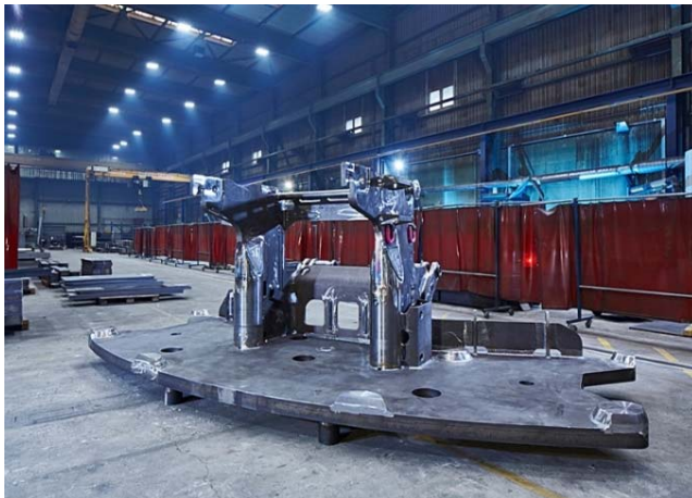
Bild 3: Präzisionsarbeit made in Germany: Aus eigenen und Zukaufteilen fertigt Jebens komplexe Baugruppen für Kräne aus Grundplatten mit Seitenwänden und Fuß.