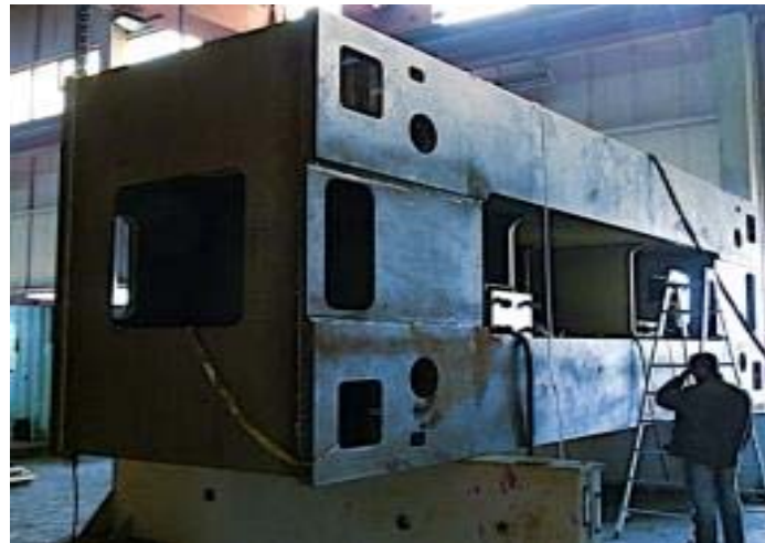
Bild 10: Jedes Pressengestell besteht aus je einem oberen und unteren Querhaupt, die mit vier Zugankern und Ständern miteinander verschraubt und vorgespannt werden.