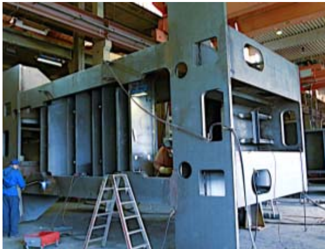
Bild 7: Kernkomponenten der Pressen sind solch große Schweißkonstruktionen von Jebens.