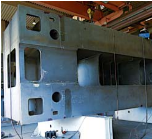
Bild 11: Das obere Querhaupt entspricht in seinen Maßen dem Pressentisch: 7.780 Millimeter breit, 2.800 Millimeter tief und 2.010 Millimeter hoch.