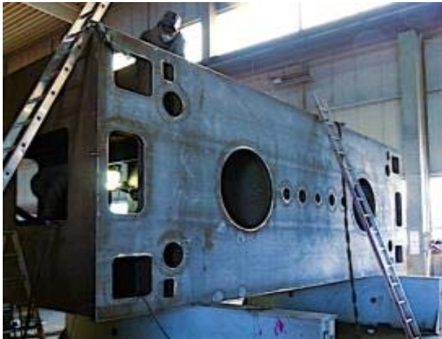
Bild 9: 62 Tonnen wiegt dieses von Jebens gefertigte obere Querhaupt für Dieffenbacher.

Brennteile und Schweißkonstruktionen für Großpressen aus einer Hand