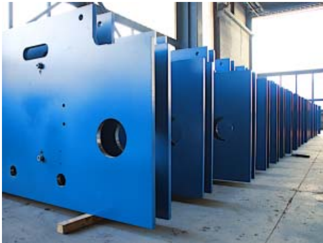
Bild 5: Ein solches Querhaupt einer CPS+ wiegt – je nach Blechdicke und –breite – zwischen 1,7 und 6,8 Tonnen.

Brennteile und Schweißkonstruktionen für Großpressen aus einer Hand