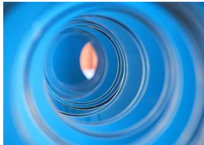
Bild 6: Präzision ist bei den Bohrungen der Querhäupter Trumpf.