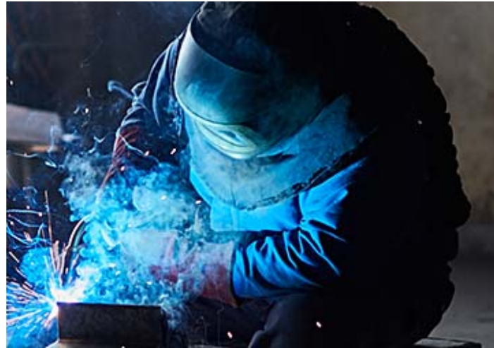
Bild 14: Bei der Umsetzung der Schweißarbeiten ist höchste Präzision Voraussetzung.