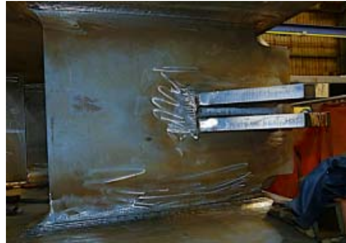
Bild 2: Kleine, filigrane Bauteile werden passgenau und fachgerecht eingeschweißt.