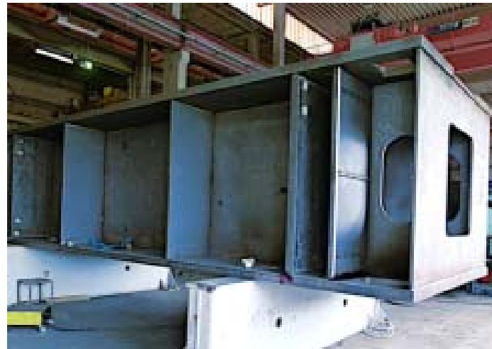
Bild 12: Das obere Querhaupt ist mit einem Gewicht von 62 Tonnen eine der schwereren Baugruppen aus den Stahlgüten S235JR oder S355J2.