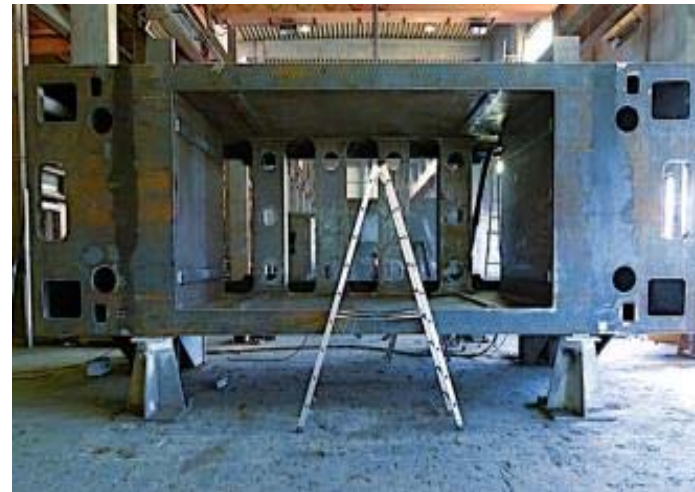
Bild 8: Brennen und Bearbeitung der riesigen, tonnenschweren Querhäupter erfordert von Jebens höchste Fertigungskompetenz.