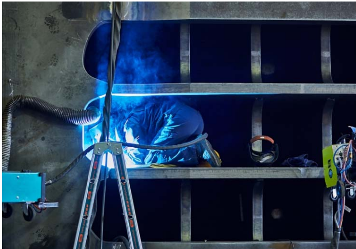
Bild 3: Allein für dieses Pressengestell benötigt Jebens knapp 600 Schweißstunden.