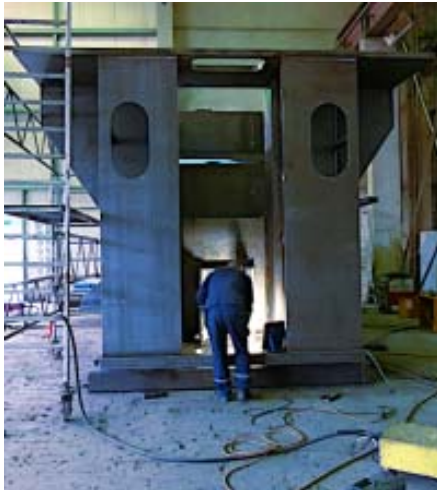
Bild 13: Dieses von Jebens gefertigte untere Querhaupt für eine Composite-Pressen bringt 95 Tonnen auf die Waage.

Brennteile und Schweißkonstruktionen für Großpressen aus einer Hand