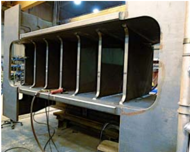
Bild 1: Dieses 3.910 Millimeter breite, 2.600 Millimeter tiefe und 7.808 Millimeter hohe Pressengestell fertigt Jebens für Dieffenbacher.

Brennteile und Schweißkonstruktionen für Großpressen aus einer Hand